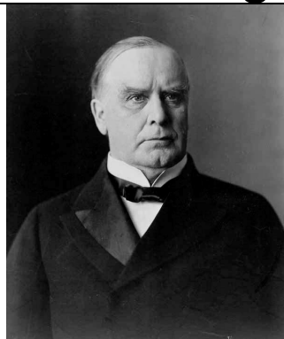
William McKinley Präsident von 1897 bis 1901