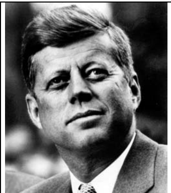
John F. Kennedy Präsident von 1961 bis 1963